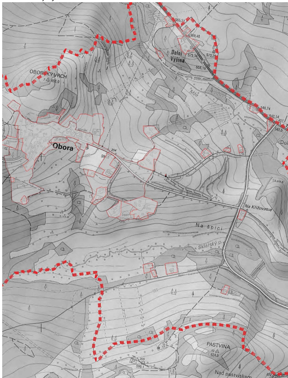
Obr.1 - Výřez katastrálního území s vyznačením zastavěného území.

Na základě požadavku pořizovatele bylo zastavěné území (ZÚ) vymezeno jako součet zastavěného území vymezeného minulým územním plánem (rudá čára) a zastavěného území zjištěného terénními průzkumy (červená čára). Takto vymezené zastavěné území je zakresleno ve výkrese A1 - Základní členění území. Hranice zastavěného území byla vymezena v souladu s §58 Stavebního zákona a zachycuje stav k 1. 1. 2017.