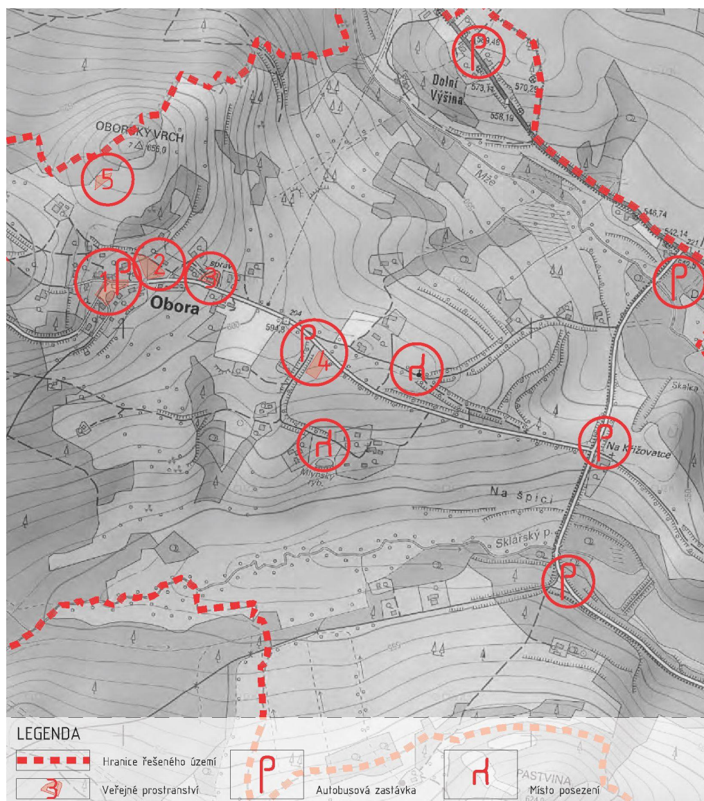
Obr.3 - Detail východní části území s veřejnými prostranstvími a dalšími malými místy

Další úrovní veřejných prostranství jsou křižovatky turistických tras a cyklotras - hájenka, bývalá Pavlova Huť a bývalý Pavlův Studenec. Na posledním místě je v rámci VPS PV/31 navrženo odpočívadlo a turistická parkovací místa z důvodu využití jedinečného potenciálu křížení hraničního hřebene Českého lesa se silnicí II. třídy spojující Hornofalcké Bärnau a západočeský Tachov. Dále se na území obce nachází řada drobných míst zastavení s lavičkou, výhledem, často zastávkou bus. Jedná se o důležité jevy pro dobré fungování území, byť nezachytitelné v podrobnosti ÚP. Tato místa jsou schématicky zachycena na obrázku níže, nachází se na veřejných pozemcích.